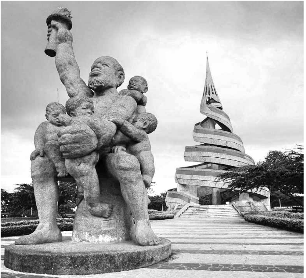
Denkmal der Wiedervereinigung in Yaundé

auch die jetzt konzentrierten politischen Eliten konnten ihr Klientel-System somit ausbauen. Schon kurz nach der Transformation der Staatsform, wurden vor der Küste der anglophonen Gebiete große Ölfelder in Betrieb genommen. Die Steuern flossen nun nicht mehr in die lokale Verwaltung, sondern direkt an die Zentralregierung. Da sowohl Minister als auch Bürgermeister nicht gewählt, sondern von der Zentralregierung eingesetzt werden, konnten alle mit Macht und Finanzmitteln ausgestatteten Ämter an treue Unterstützer Ahidjos vergeben werden. Nach dem Rücktritt des 1. Präsidenten 1982 ist der Vertreter der Volkspartei CPDM Paul Biya nun bereits 35 Jahre der 2. Präsident Kameruns. Mit seinem