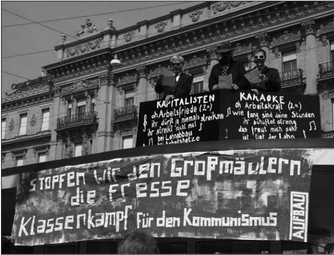
Zürich: Revolutionäre 1. Mai-Demonstration 2005

eine kreislaufförmige Wirtschaft in möglichst abgegrenzten (nationalen) Räumen, die dem natürlichen Gang der Dinge entspräche. Damit einher geht häufig eine Kritik an Luxusgütern und dekadentem Lebenswandel, die schuld an einer ungerechten Verteilung seien. Aber genauso wenig, wie die gesellschaftlichen Eigentumsverhältnisse kritisiert werden, gibt es gerade bei den Rechten eine Kritik an Konkurrenz und Unternehmertum, die eine Auslese der Tüchtigsten und besten garantiere und so den Volkkörper veredele.