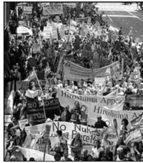
1. Mai-Demo in New York