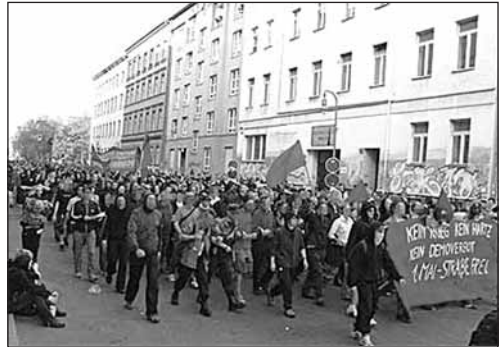
Autonome 1. Mai-Demonstration in Berlin 2005

Wenn Geld verliehen wird, wird dabei seine potentielle Fähigkeit, einen Profit zu erzielen, verkauft. Der Preis des Verleihs ist der Zins. Ohne die Möglichkeit der Kreditaufnahme wäre es für