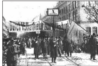
Der 1. Mai 1919 in Wien

einer gesellschaftlichen Solidargemeinschaft des Proletariats durch die einer Schicksalsgemeinschaft der Nation ersetzt wurde. Mit einer ähnlichen Argumentation wurde auch die Bewilligung der Kriegskredite von der SPD erreicht. Als sich die deutsche Situation im Ersten Weltkrieg zunehmend verschlechterte, verordneten Erich Ludendorff und Paul von Hindenburg als faktische Militärdiktatoren dem Land eine militärisch