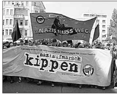
Berlin: Demonstration gegen geplanten Nazi-Aufmarsch am 1. Mai 2005

Nach 1945 wurde der 1. Mai auch in den Statuten der Alliierten als Feiertag festgeschrieben. In der DDR später als staatlich verordnete Parade begangen, in der BRD als klassische Demonstration der Gewerkschaften, ein ritualisiertes Brat-