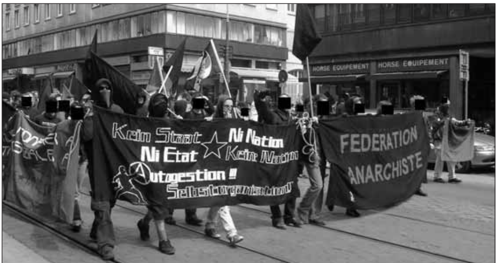
Straßburg: Französisch-deutsche Demonstration am 1. Mai 2006