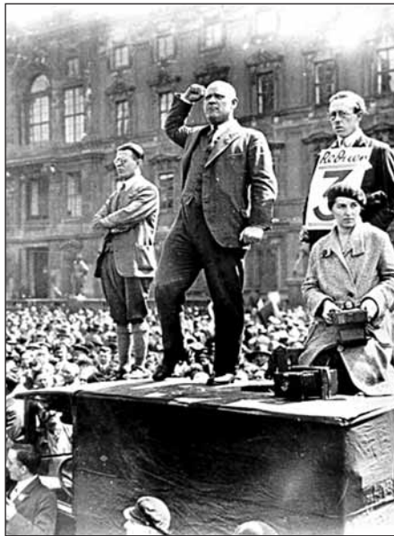
Mai-Kundgebung mit Ernst Thälmann im Berliner Lustgarten 1930

Produktionsmittel. Für ihre Arbeit erhalten sie weniger zurück, als diese wert ist, sonst hätte die andere Seite, die Produktionsmittelbesitzer_innen, keine Motivation, ihre Mittel zur Verfü-