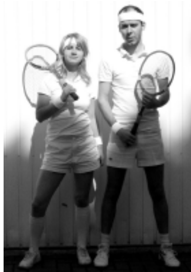
radiokonzert am 29.9.: jackfuckingtwist (foto) u.a.

Dies ist mehr Programmach- als -vorschau. Wir sind zu sehr dem Hier und Jetzt verhaftet, als dass wir sgen könnten , was im Oktober sein wird. Die Septembersondung wird sich dann schon mit dem Theremin beschäftigt haben. Würdig vorgestellt und gespielt von Theremina, nein