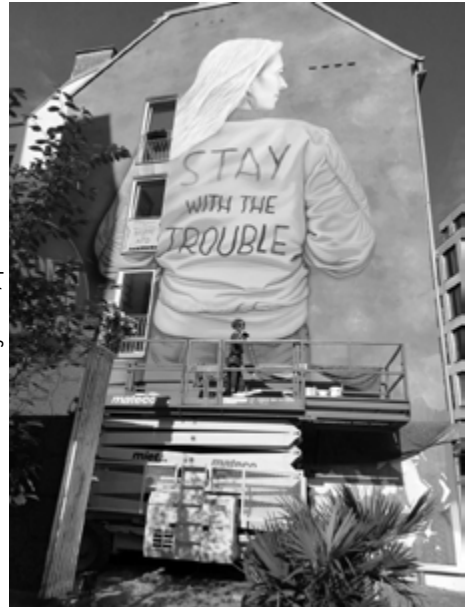
Hausfassade im Gängeviertel, Speckstraße